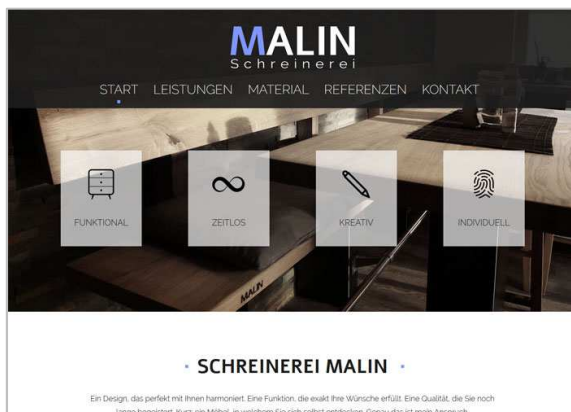
Schreinerei Malin, Bermatingen www.schreiner-malin.de