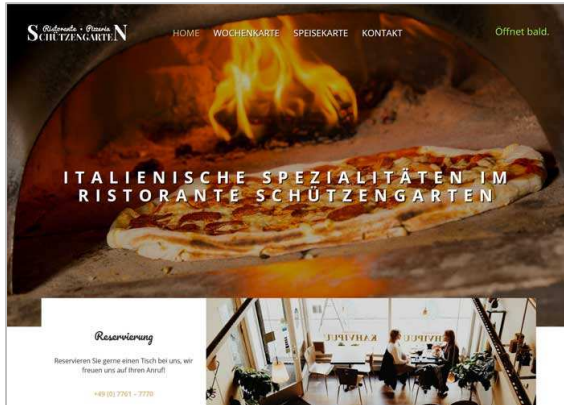
Ristorante Schützengarten, Bad Säckingen: www.ristorante-schuetzengarten.de