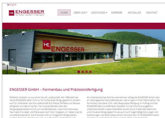
Engesser GmbH, Geisingen www.engesser.de