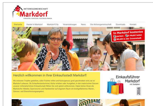
Aktionsgemeinschaft Markdorf www.markdorf-city.de