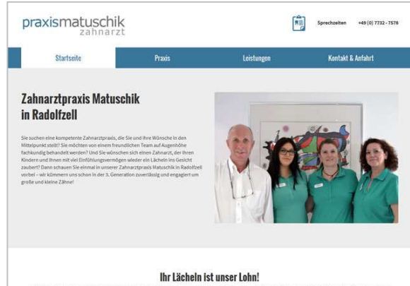
Zahnarztpraxis Matuschik, Radolfzell www.zahnarzt-matuschik.de